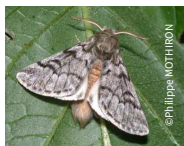
Adulte femelle sur feuille